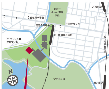
国立京都国際会館 アネックスホール